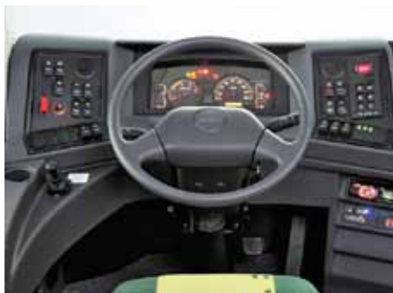
Přístrojová deska je přehledná