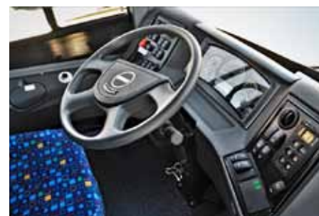
Ergonometrické pracoviště řidiče