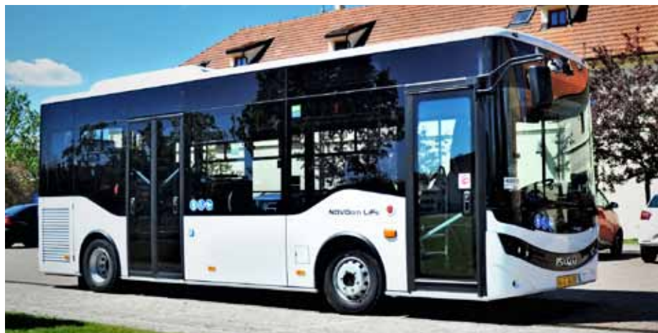
Městský autobus ISUZU Novociti Life

J edná se o zcela odlišnou konstrukci oproti nám všem známým předchozím modelům ISUZU, prodávaným v České republice a na Slovensku. Konstruktoři z Anadolu ISUZU vyvinuli nově specifický model malého městského autobusu Low Entry (LE) s více než třemi čtvrtinami nízkopodlažního prostoru. Autobus dlouhý pouhých 7,9 m je vhodný zejména pro dopravu ve stísněných podmínkách v městských centrech, a na místech s menší frekvencí cestujících. Autobus je však dobře využitelný i na meziměstských linkách, díky optimálně nastaveným parametrům i pro jízdu mimo obec. Maximální kapacita autobusu je až 60 míst. Vybavený je osvědčeným motorem FPT NEF 4 (Fiat Powertrain Technologies) v kombinaci s plně automatickou převodovkou Allison 2100. Unikátní je také provedení zadní nápravy s propojením do převodovky, tzv. převodem „Z“, od renomovaného výrobce Brist, který byl vyvinut speciálně pro model Novociti Life. Pneu-